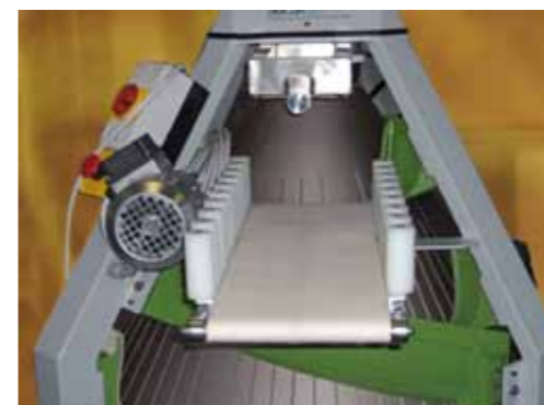
Arrotondatrice conica con tappeto in uscita Conical rounder with exit conveyor belt