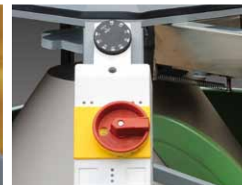
Termostato regolabile Adjustable thermostat